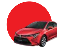
3R3 | RED MM