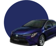
8X8 | DK. BLUE MC.