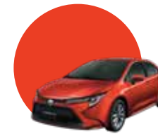
3U4 | SCARLET ME