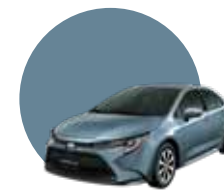
1K3 | CELESTITE GRAY ME.