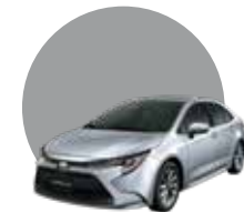
1F7 | SILVER ME