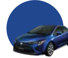
8W7 | DK. BLUE MM.