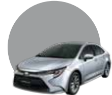
1F7 | SILVER ME