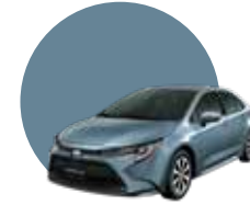
1K3 | CELESTITE GRAY ME.