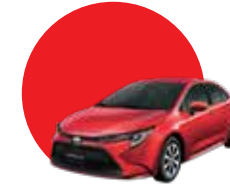
3R3 | RED MM