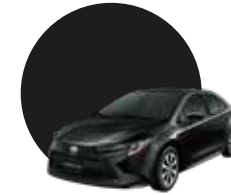
209 | BLACK MC