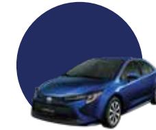
8X8 | DK. BLUE MC.