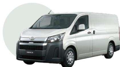
058 | BLANCO