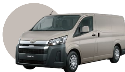
4R4 | BEIGE MET. *SOLO DISPONIBLE LHP4-LHA2