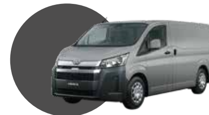
1E7 | SILVER MICA MET