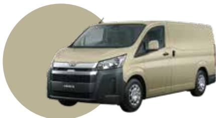
4R4 | BEIGE MM