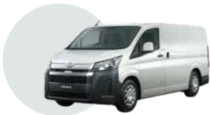
058 | WHITE