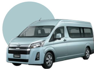
8Q6 | CELESTE MET.