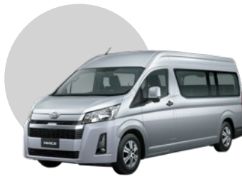
1E7 | SILVER MICA MET