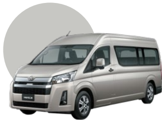
4R4 | BEIGE MET