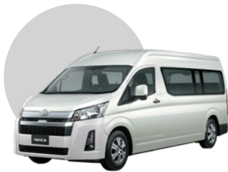
058 | BLANCO