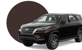
4W9 | CAFE METÁLICO