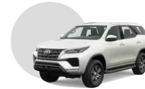
040 | BLANCO