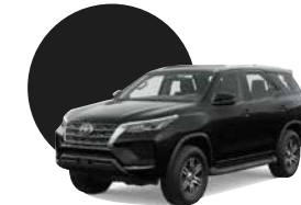
218 | NEGRO