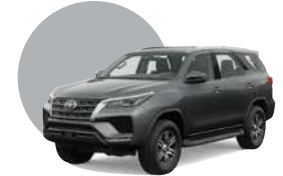
1G3 | GRIS METÁLICO