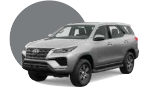
1D6 | SILVER METÁLICO