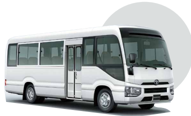
058 | BLANCO