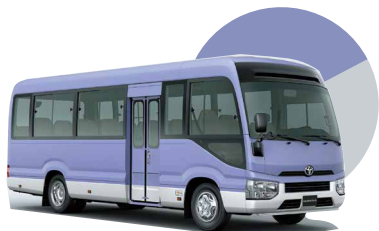
2KA | LAVANDA AZUL CON BLANCO