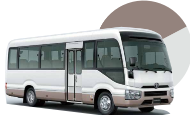
2JP | BLANCO CON BEIGE