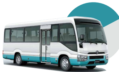
2HL | BLANCO CON TURQUESA