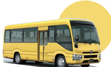
541 | AMARILLO