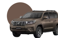
4V8 | BRONCE METÁLICO