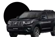
218 | NEGRO METÁLICO