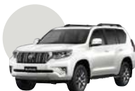
070 | BLANCO PERLADO