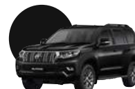
202 | NEGRO