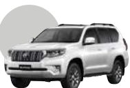
040 | BLANCO