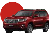
3R3 | ROJO MICA MET