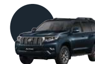
221 | AZUL OSCURO