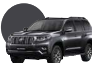
1G3 | GRIS METÁLICO