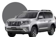
1F7 | SILVER MET