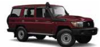
ROJO METÁLICO 3Q3