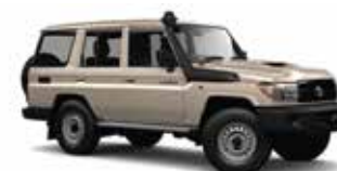
BEIGE METÁLICO 4R3