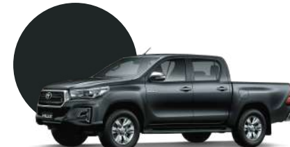
1G3 | GRIS MET