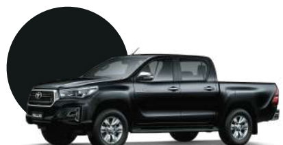
218 | NEGRO