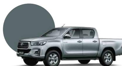
1D6 | PLATEADO