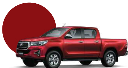
3T6 | ROJO MET