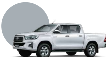
040 | BLANCO