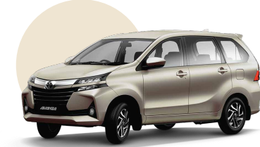
T23 | CHAMPAGNE MET