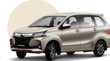
T23 | CHAMPAGNE MET