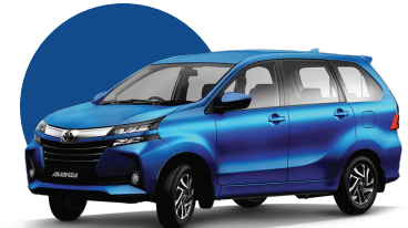
B79 | DARK BLUE