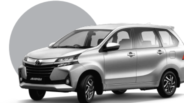
1E7 | SILVER M MET