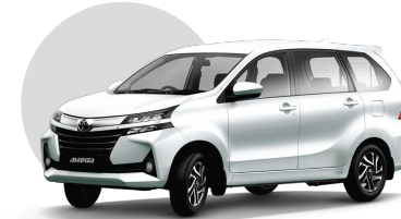
W09 | WHITE