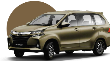
4T3 | BRONZE