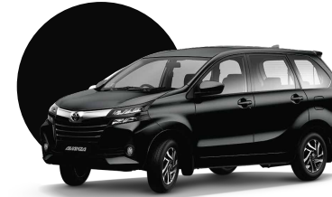
X12 | BLACK ME