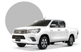
070 | BLANCO PERLADO