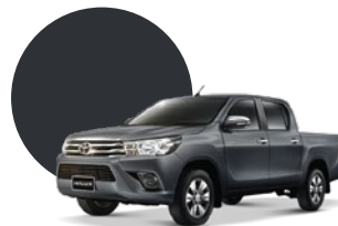
1G3 | GRIS METÁLICO