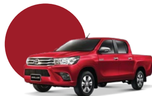
3T6 | ROJO METÁLICO