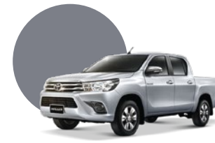
1D6 | SILVER