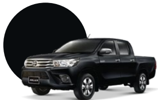
218 | NEGRO