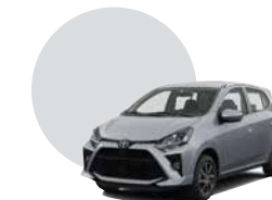
1E7 | SILVER METÁLICO