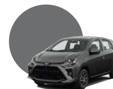
1G8 | GRIS METÁLICO