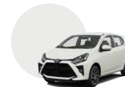
W09 | WHITE