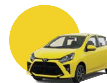
Y13 | AMARILLO