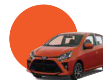
R71 | NARANJA