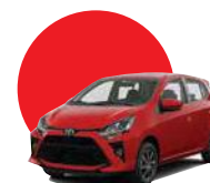
R40 | ROJO