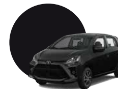
X13 | NEGRO