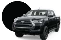
218 | NEGRO