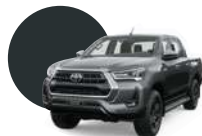
1G3 | GRIS METÁLICO