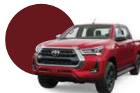
3T6 | ROJO METÁLICO