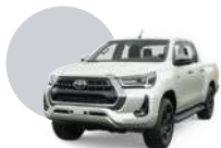
070 | BLANCO PERLADO