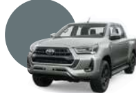
1D6 | SILVER