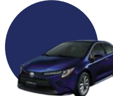
8X8 | AZUL OSCURO MICA