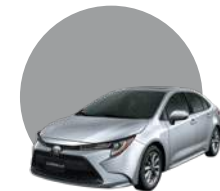
1F7 | SILVER ME