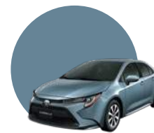
1K3 | CELESTE GRISÁCEO MET.