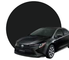
209 | NEGRO MICA