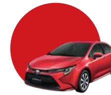
3T3 | ROJO MICA