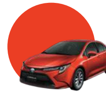
3U4 | ESCARLATA MET.