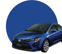
8W7 | AZUL OSCURO MICA MET.