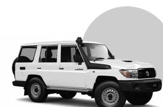
058 | BLANCO