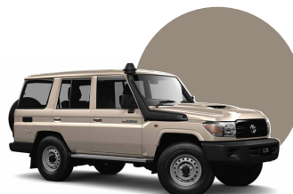
4R3 | BEIGE MET