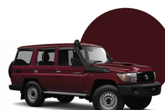
3Q3 | ROJO MET