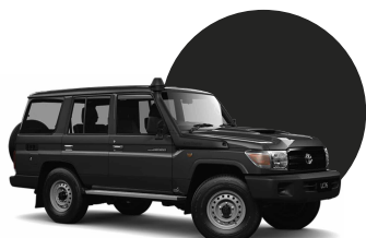
1G3 | GRIS MET