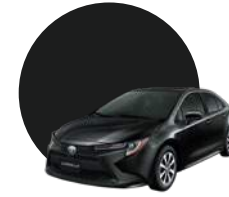
209 | NEGRO