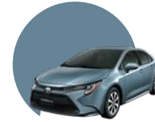
1K3 | CELESTE GRISÁCEO METÁLICO