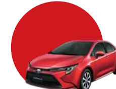
3T3 | ROJO MICA