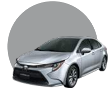
1F7 | PLATEADO