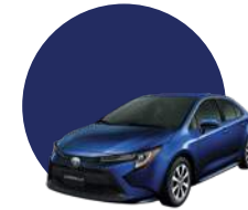
8X8 | AZUL OSCURO